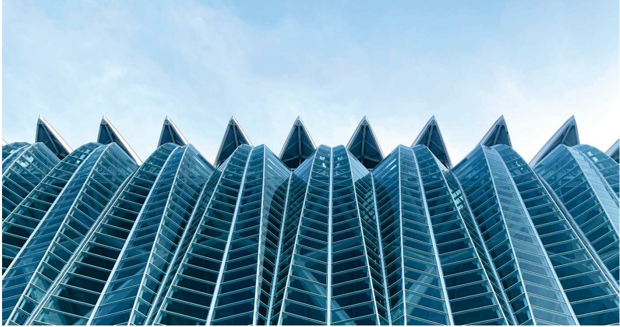
3 er premio 2023: Catarata de cuadriláteros de cristal , de Vojtěch Kanta, Gymnázium Jaroslava Vrchlického de Klatovy.